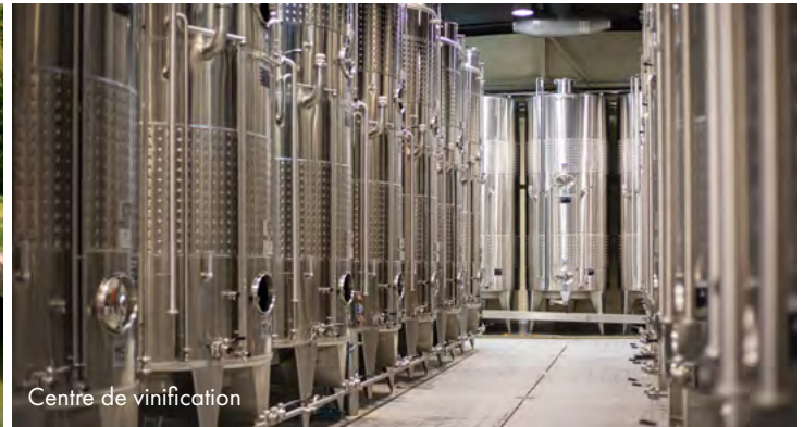
Centre de vinification

Dégustez 2 crus du Beaujolais ou du Mâconnais en salle de dégustation avant de poursuivre votre visite avec notre spectacle l'Impérial dans l'ancienne gare de Romanèche-Thorins. Pendant la période estivale, profitez également de notre jardin et du centre de vinification des Vins Georges Dubœuf pour faire une promenade ressourçante à la découverte des arômes du vin.