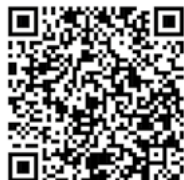
Vidéo de présentation

Nous nous tenons à votre disposition pour répondre à toutes vos questions et vous aider à organiser votre événement entre nos murs.