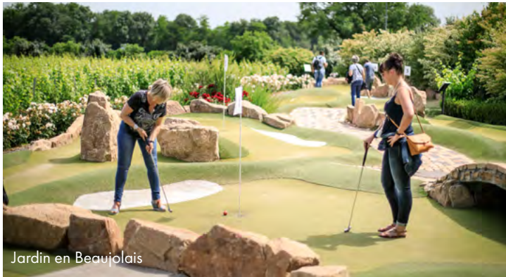
Jardin en Beaujolais