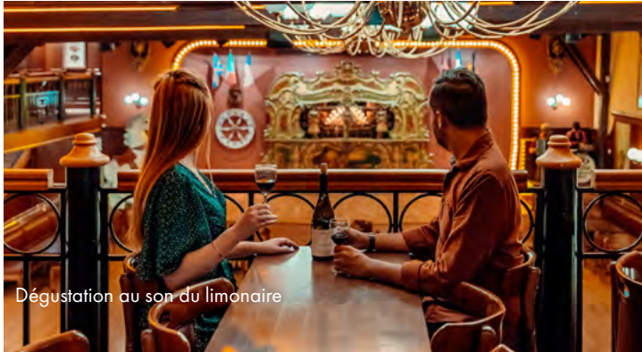
Dégustation au son du limonaire