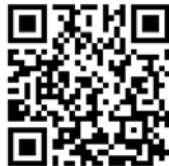
Vidéo de présentation

Pendant la belle saison , plongez au centre du métier de la production viticole et découvrez les senteurs de fleurs, d'écorces, de fruits et d'épices qui font la richesse des arômes du vin du Jardin en Beaujolais . Des activités vous permettent également de découvrir ce lieu à travers une balade en rosalie ou sulky ou de faire une partie de mini-golf .